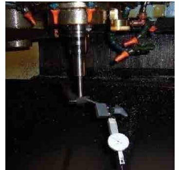
▲ マシニングセンターへ

※商品の価格および詳細は、下記 QR コードから弊社ホームページでご確認お願い致します。