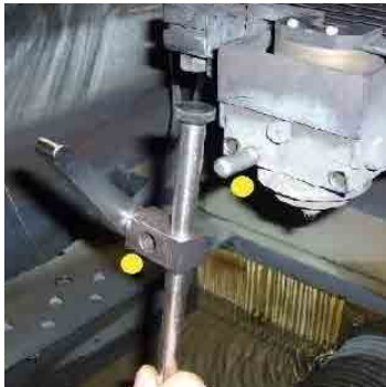
▲ ワイヤ加工機にシンプルでスマートな取り付けが可能