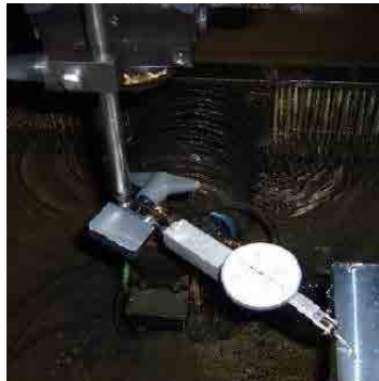
▲ ワイヤ加工機での測定